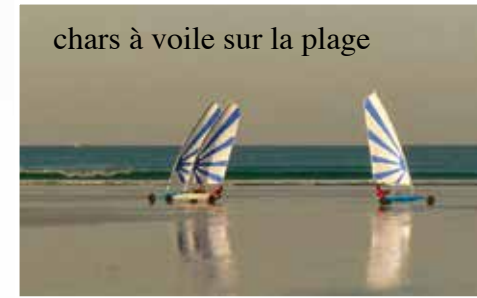
chars à voile sur la plage